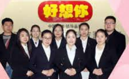
行政中心信息部 主导实施公司信息化建设，该方案、做修订、建模型、录数据，一点一滴，脚踏实地，为公司信息化建设打下了坚实基础，成功打造“好想你信息化实施年”。