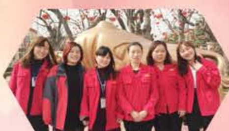
生产中心零片二部 分工明确，人人以控制差错为切入点，全年生产零投诉；加班加点完成旺季包装零片生产13646件，订单率达100%；在新品新设备操作不稳定期间，生产红枣零片3400件。