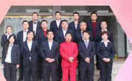
财务中心投资管理一部 一切从零开始，从起步开始，从她热爱的好想你开始。别人离开的时候，她留下来；别人收获的时候，她还在耕作。她凭着对事业的忠诚，一心为公司省费用，做到资金使用零差错。