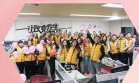
电商事业部 全年实现销售同比增长59.53%，其中京东平台同比增长率高达373%；跨界营销策划，打造“520好想你表白日”，一举成为业界历史第一营销案例，销售成功突破1000万元。