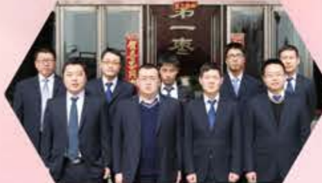
行政中心信息部 主导实施公司信息化建设，该方案、做修订、建模型、录数据，一点一滴，脚踏实地，为公司信息化建设打下了坚实基础，成功打造“好想你信息化实施年”。