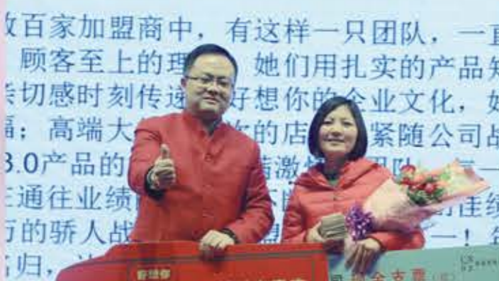
他们是郑州东区加盟商团队，在全国数百家加盟商中勇往直前，用1186万元的销售业绩笑傲加盟商团队，赢得了年终销售大奖和O2O移动专卖车1辆及5万元现金支票。